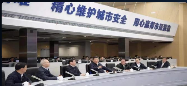
国家新区典型案例—浦东