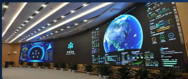
省会城市典型案例—智慧泉城