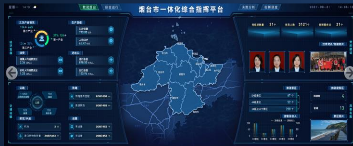
烟台综合慧治平台

成立智慧泉城智能科技有限公司，建设城市大脑、运行管理中心、交通大脑、城市运行管理服务平台，运行管理中心加挂智慧泉城创城指挥中心牌子，打造文明创建“党心民心、便民惠企、市民出行、城市管理、公共安全、青山绿水”的六大领域智慧应用