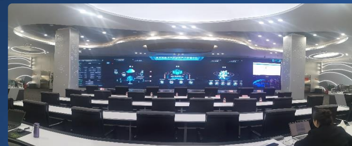
直辖市典型案例—智慧重庆