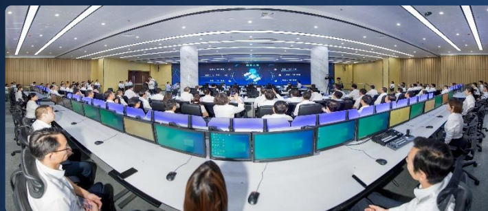
工业城市典型案例—智慧攀枝花