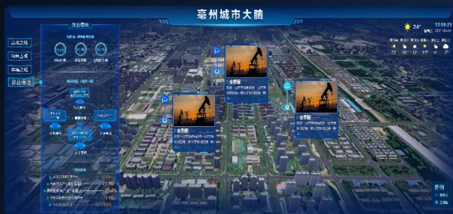
农业城市典型案例—智慧亳州